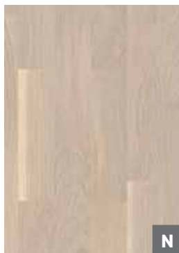
Eiche Concerto weiß