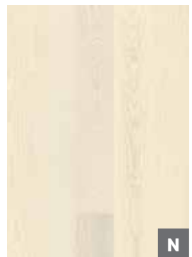
Eiche Andante weiß*